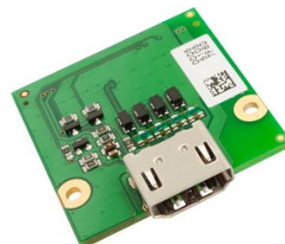
SINTF-ADP-DVI Adapter zum Anschluss eines DVI-Monitors (Zubehör)