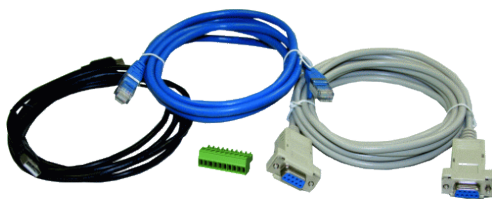
Kabelsatz (im PicoMODA9-KIT enthalten)

Zusätzlich besteht die Möglichkeit noch Displayadapter oder LVDS Displaykabel zu bestellen ( Section 4 ).